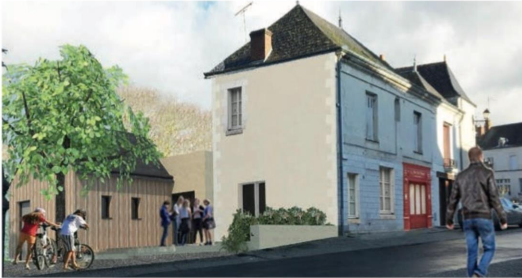
▲ Vue du projet : Atelier d'architecture Frédéric Temps

Après d'importants travaux d'embellissement de son cœur de village, la Mairie de Tauxigny-Saint-Bauld a fait l'acquisition de bâtiments en centre-bourg pour l'implantation du nouveau commerce. D'importants travaux de rénovation sont en cours, et la mise à disposition des locaux est programmée au premier trimestre 2021. Ce local commercial sera d'une surface d'environ 120 m 2 et sera doté d'une terrasse extérieure et d'un espace végétalisé.